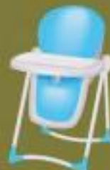
Стульчик для кормления