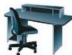
Компьютерный стол и стул