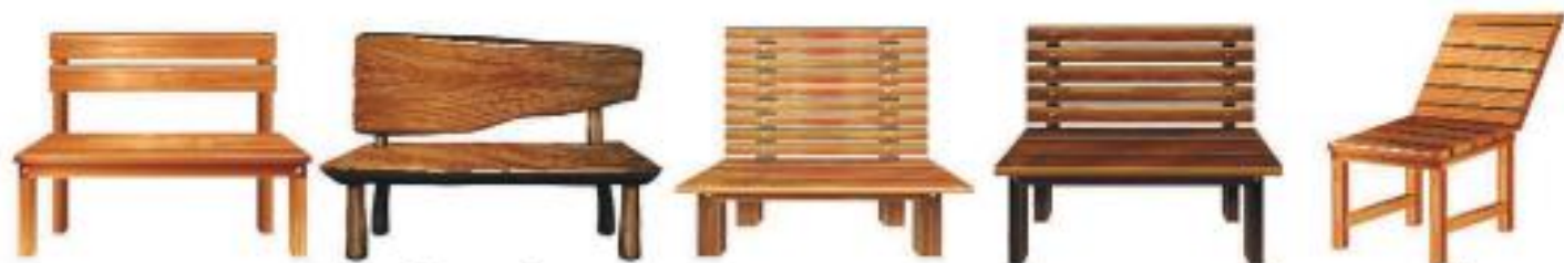
Скамейки для отдыха в саду