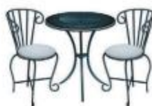
Кованая мебель для отдыха